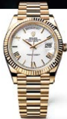
OYSTER PERPETUAL DAY-DATE 40