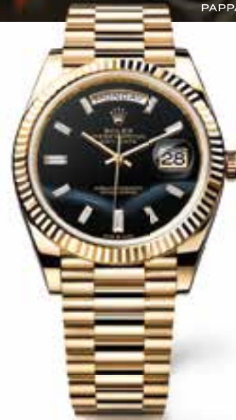
OYSTER PERPETUAL DAY-DATE 40